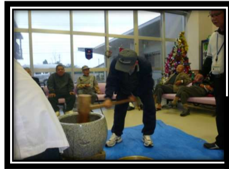
も ち つ き 会