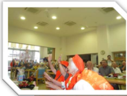
米 寿 の 祝 い