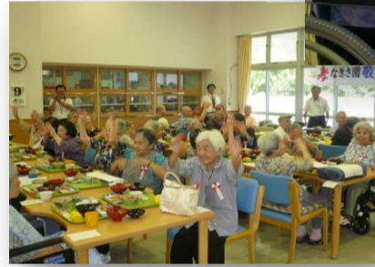
敬 老 祝 賀 会