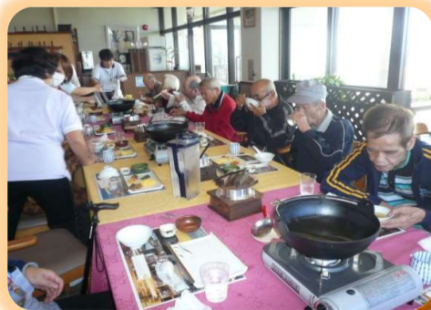
遠 足 ( 外 食 )