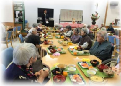
元 日 式 典