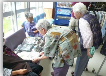
松 元 洋 品 店 出 張 販 売